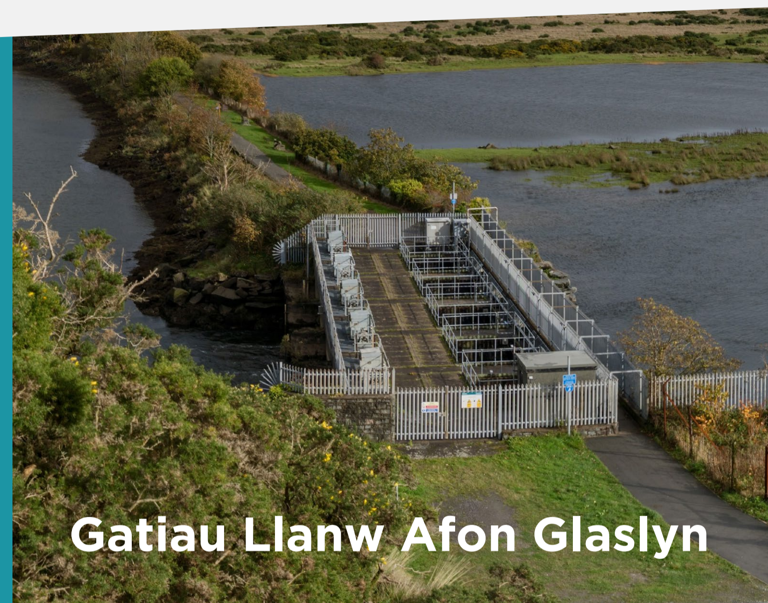
Gatiâu Llanw Afon Glaslyn

Trwy'r astudiaeth hon, rydym yn datblygu ein dealltwriaeth o berygl llifogydd a swyddogaeth yr amddiffynfeydd er mwyn inni barhau i amddiffyn cartrefi a busnesau yn yr hirdymor.