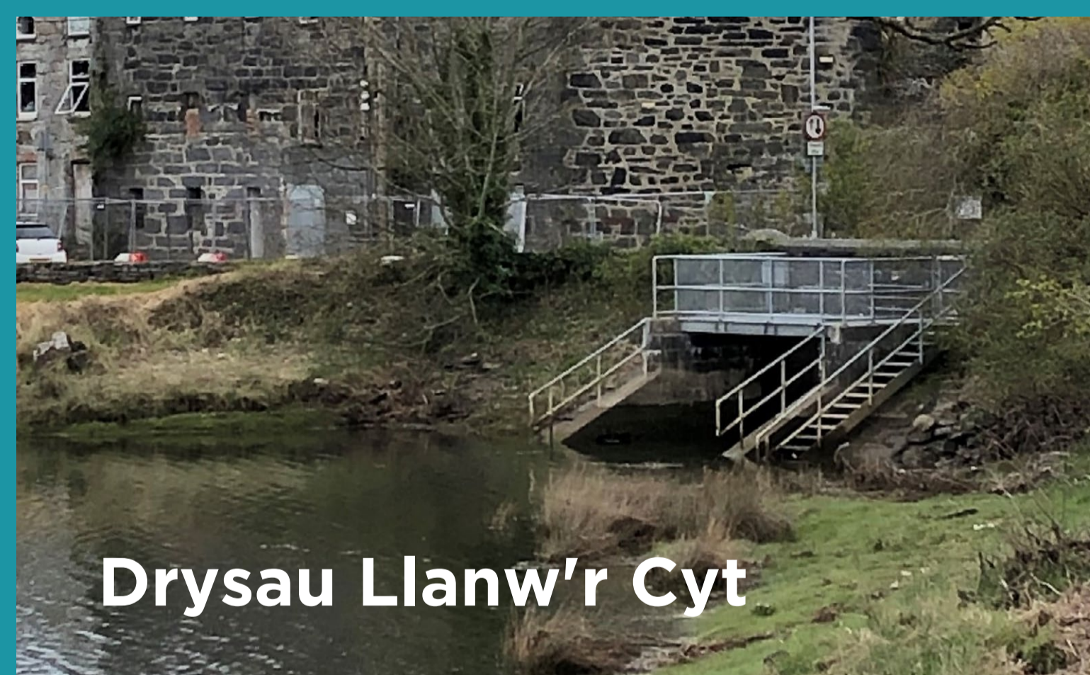
Drysau Llanw'r Cyt