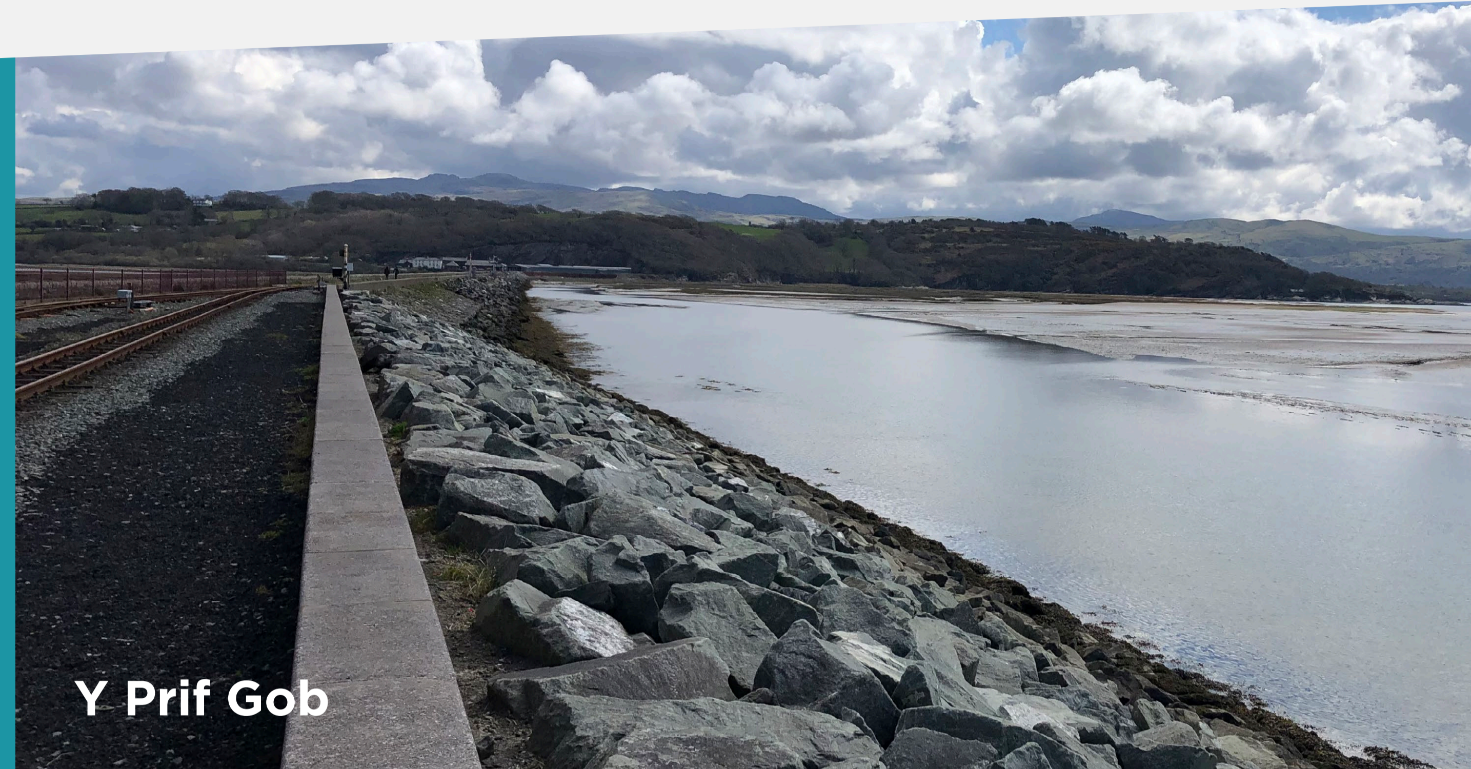
Y Prif Gob