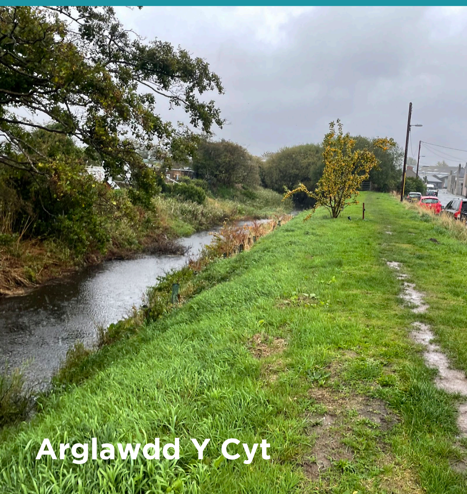
Arglawdd Y Cyt