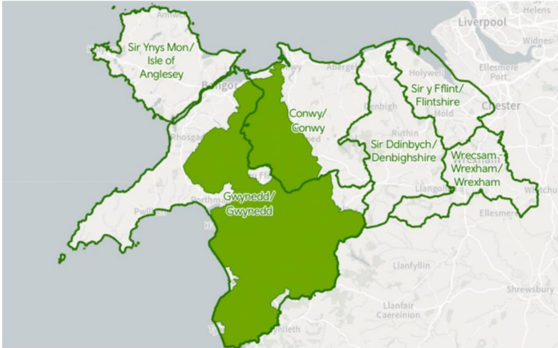
Ffigwr 1- Awdurdodau Lleol a gynhwysir yng Nghynllun Trafnidiaeth Rhanbarthol Gogledd Cymru (gyda Pharc Cenedlaethol Eryri mewn gwyrdd)